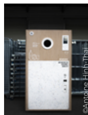
Borne Lemon Tri

* Liste non exhaustive pour un marché en rapide évolution.