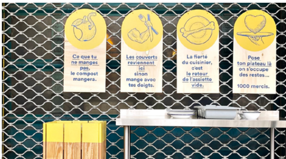
Meuble de retour de la vaisselle réemployable à Ground Control (Paris 12 e )